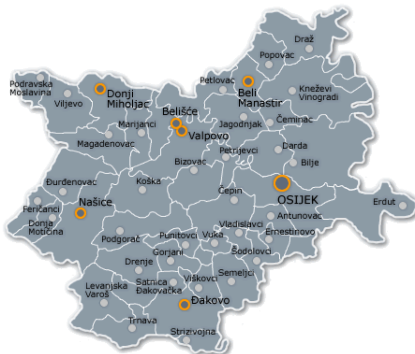
Slika 1. Položaj Općine Drenje u Osječko-baranjskoj županiji

Općina Drenje je udaljena 15-tak kilometara od Đakova i ima povoljan geoprometni položaj jer je duž granične zone između brežuljkastog i ravničarskog terena položena trasa državne ceste D515, koja predstavlja najznačajniju cestovnu prometnicu na području općine. Navedena državna cesta spaja dva značajna prometna čvorišta istočne Hrvatske: Našice i Đakovo.